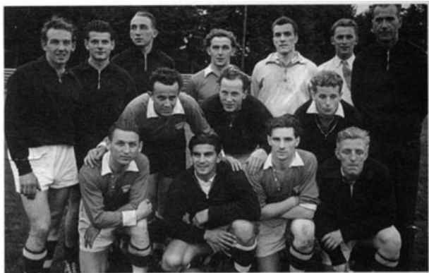
Maandag 26 juli 1954, spelers en begeleiders zijn klaar voor de eerste training.